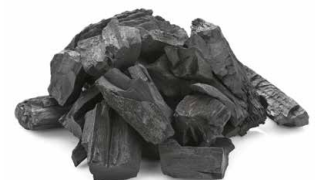
Aufbereitete Kohle Processed coke